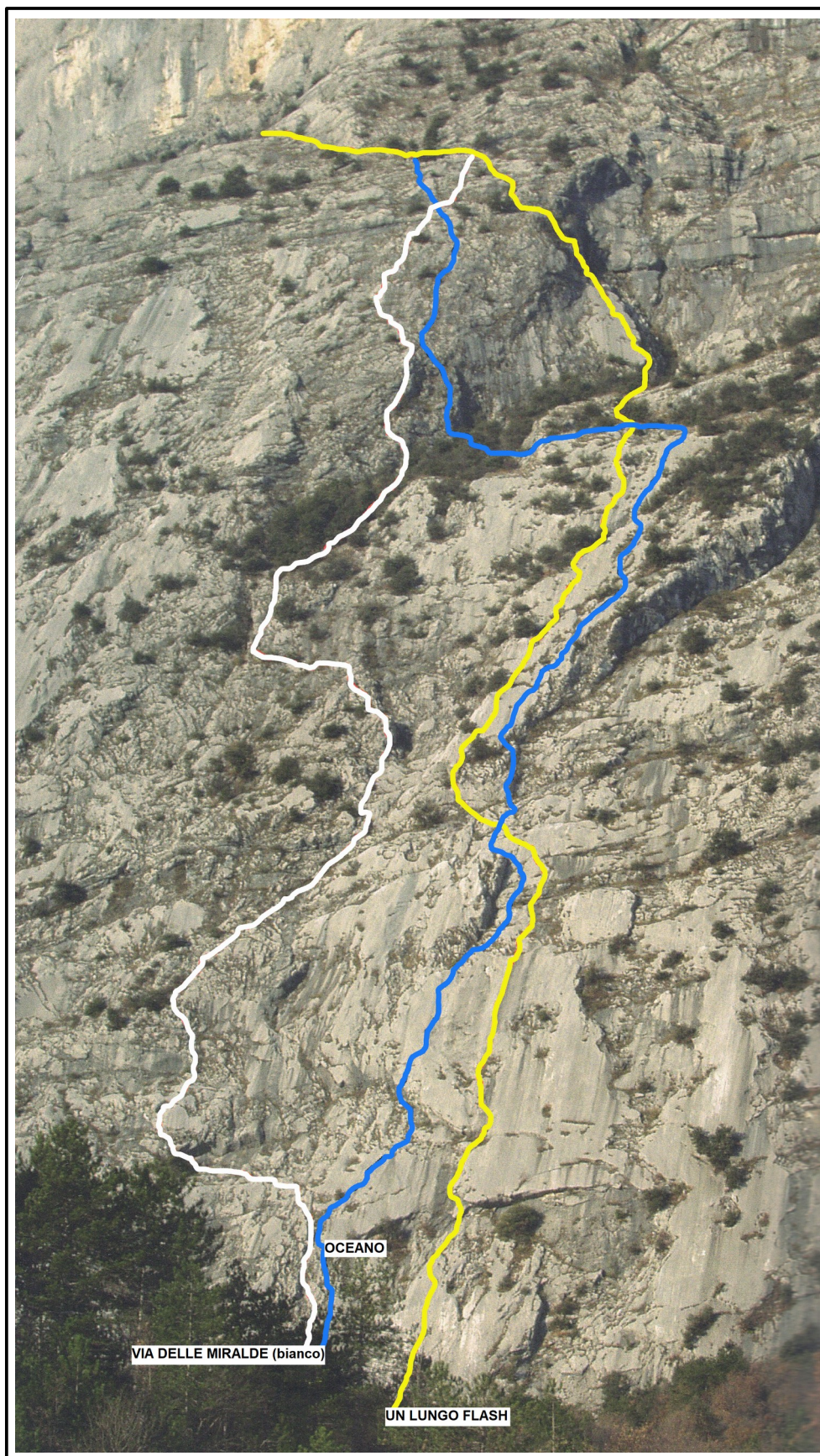
In GIALLO il tracciato di “Un lungo flash”.